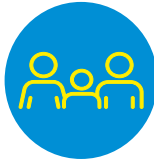
Схема для української родини (уряд Великої Британії)

«Схема для української родини» — це програма, яка допомагає українцям об'єднати членів родини. Заявку можна подати безкоштовно. Це програма надасть можливість жити, працювати й навчатися у Великій Британії та мати доступ до державних коштів (наприклад, пільг).